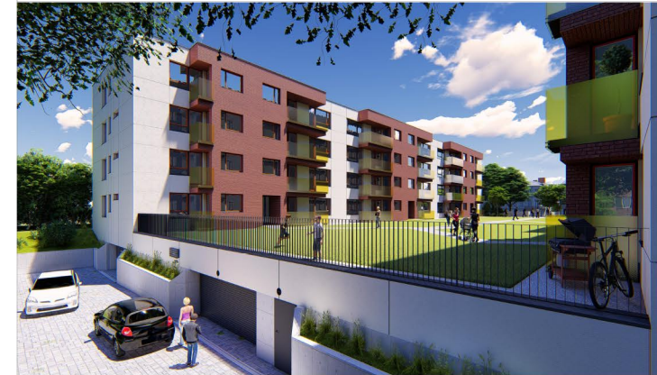
LOKALIZACJA W BUDYNKU