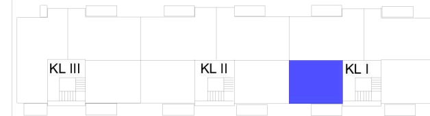
BUDYNEK C, LOKAL MIESZKALNY NR 9, PIĘTRO II