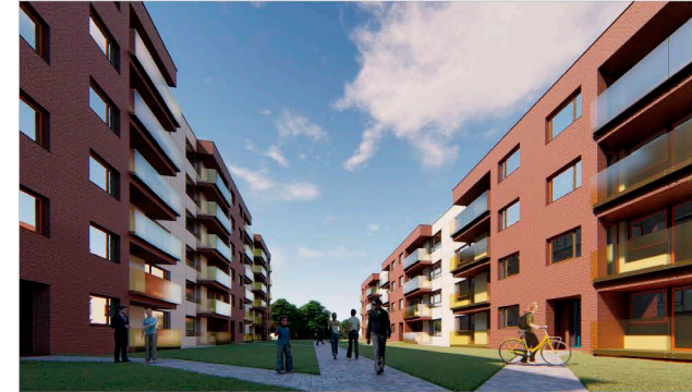
LOKALIZACJA W BUDYNKU